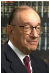
Alan Greenspan (Economista)