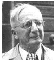
Alfred Döblin (Novelista)

“...pero en cuanto a la elección, son amados por causa de los padres”. Las promesas de Dios hechas a los patriarcas Abraham, Isaac y Jacob, y también a David, tienen que ser (y lo serán) literalmente cumplidas (Leer el Salmo 89). La incredulidad presente de los judíos al Evangelio, es usada por Dios para la salvación de los gentiles, pero ella, no anula lo prometido por Dios a “los padres” mediante el pacto que hizo con ellos.