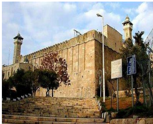
Este es hoy día el Edificio por donde se entra a la Tumba de los Patriarcas, en Hebrón.

Ahora le tocó el turno de morir a Isaac a los “ciento ochenta años...y lo sepultaron Esaú y Jacob sus hijos” (Gén.35:28,29).