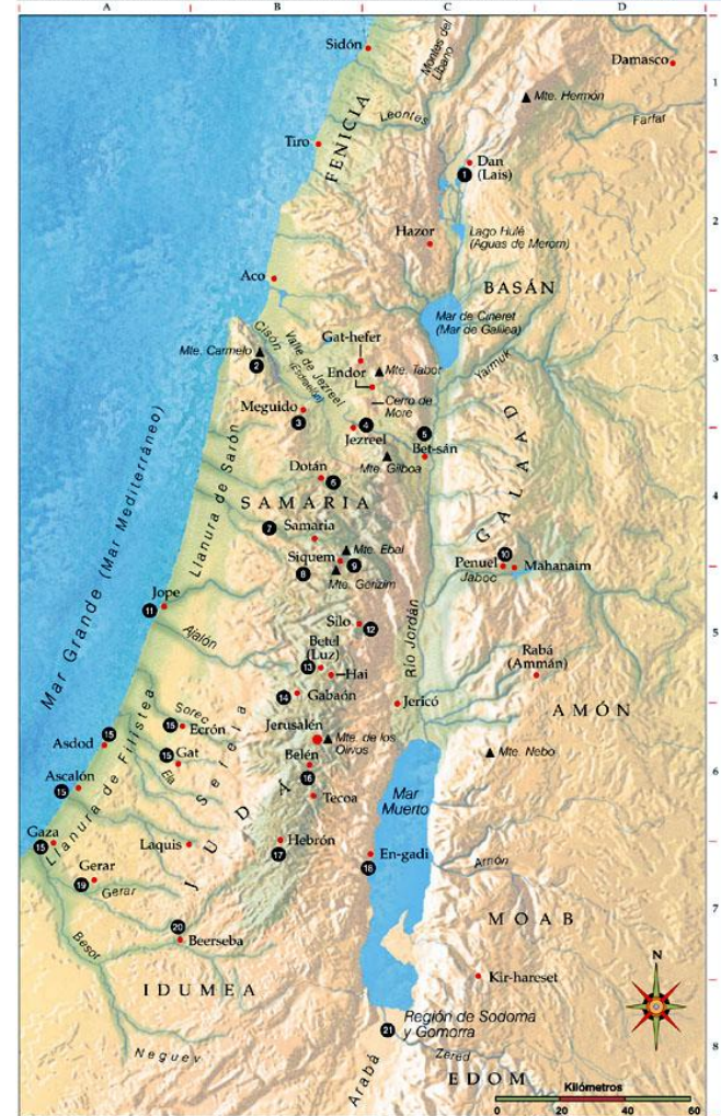
CANAÁN EN LOS TIEMPOS DEL ANTIGUO TESTAMENTO MAPA 10

Los acontecimientos más sobresalientes de la vida de Jacob fueron la teofanía de la escalera celestial y la bendición en Bet-el ( Gén. 28. 10-22 ) y el cambio de su nuevo nombre ( Gén. 32.24-32 ). Es importante destacar la historia de las rivalidades de sus hijos, hasta la venta de José, a los mercaderes que le llevaron luego a Egipto y cómo José asegura la salvación de sus hermanos.