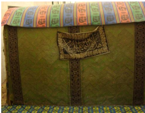
Sepulcro de Jacob en Hebrón (“Cueva de Macpela”)

Y llegando al lugar de Hebrón, “lo sepultaron en la cueva del campo de Macpela, la que había comprado Abraham” y después, regresaron de nuevo a Egipto (50:4-14).