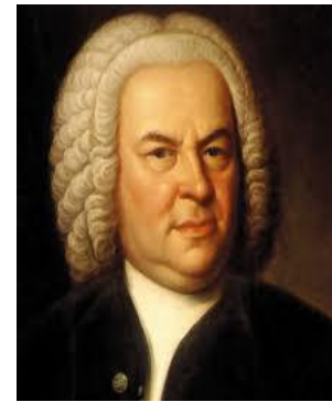
Juan Sebastián Bach

Nació en Nuremberg (Alemania) el 26 de Octubre de 1.564 y fallecido el 8 de Junio de 1.612 . Hijo de una familia de organistas, cuyos inicios decisivos en la música, tuvieron lugar en Nuremberg con Friedrich Lindner y Leonard Lechner. Pero, la armonización de dicho himno se la debemos al compositor alemán: