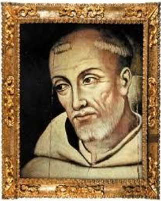
Bernardo de Claraval

La letra de este himno se le atribuye a este monje eclesiástico francés, nacido a finales del año 1.090 en Borgoña (Francia) y fallecido el 20 de Agosto de 1.153 . Su padre fue “Caballero del Duque de Borgoña” y siendo el tercer hijo, fue educado en la escuela católica de “ Châtillon-sur-Seine ”.