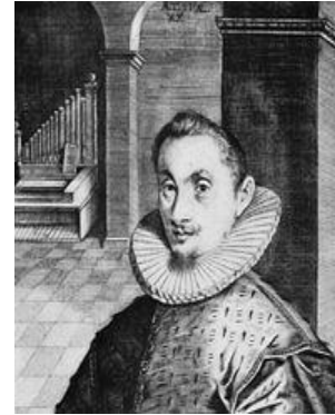
Hans Leo Hassler

La música con la que conocemos este himno, le fue puesta por el compositor y organista alemán: