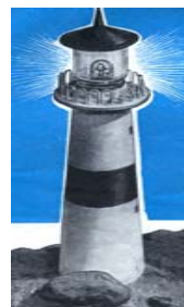
"Yo soy la luz del mundo" S. Juan 8:12