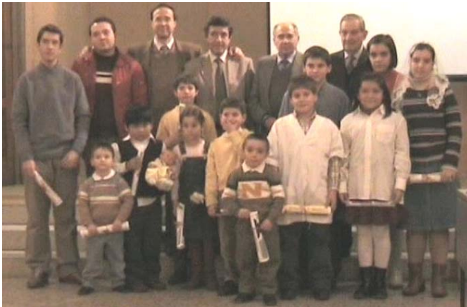
Graduación del Programa infantil del 2006

En ese deseo que tenía para que la siguientes generaciones fuesen formadas en la Palabra de Dios, sentía una profunda alegría y satisfacción con la entrega de diplomas a los estudiantes de la escuela dominical por sus esfuerzos.