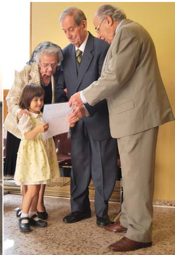
Graduación Escuela Dominical 2009-2010