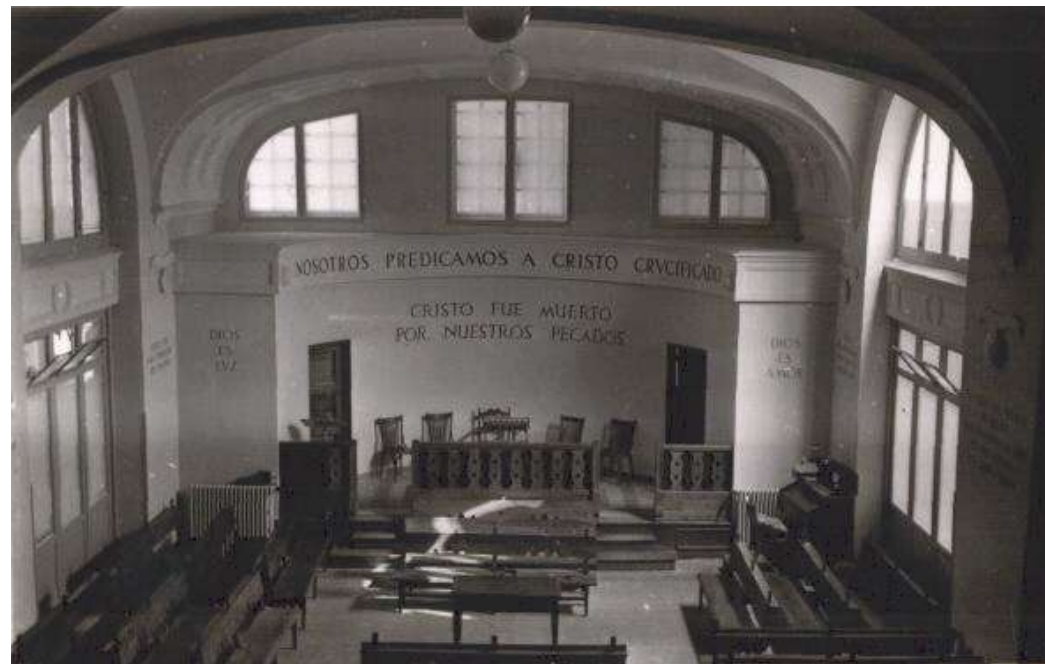
Sala central del local de cultos de la Iglesia de Trafalgar (Años 50)