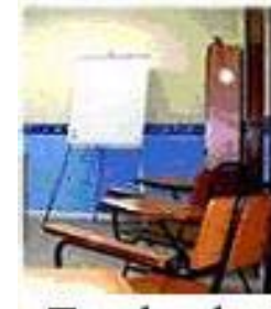
En el aula

Esos momentos tienen que pasarlos ellos solos y el único que puede ayudarles es el Señor Jesucristo, cuanto más conozcan de Su Palabra, más fieles serán.