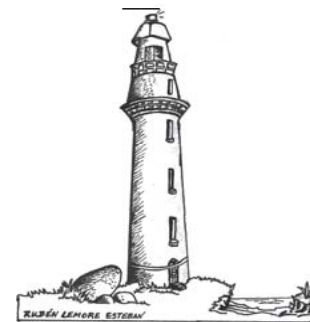
“Yo soy la luz del mundo” S. Juan 8:12

“Y todo lo que hagáis, hacedlo de corazón, como para el Señor y no para los hombres; sabiendo que del Señor recibiréis la recompensa de la herencia, porque a Cristo el Señor servís” Colosenses 3:23-24