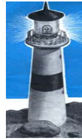
“Yo soy la luz del mundo” S. Juan 8:12