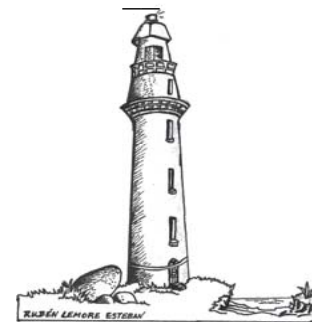
“Yo soy la luz del mundo” S. Juan 8:12

“Y todo lo que hagáis, hacedlo de corazón, como para el Señor y no para los hombres; sabiendo que del Señor recibiréis la recompensa de la herencia, porque a Cristo el Señor servís” Colosenses 3:23-24